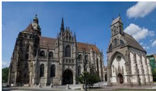
Dóm svätej Alžbety